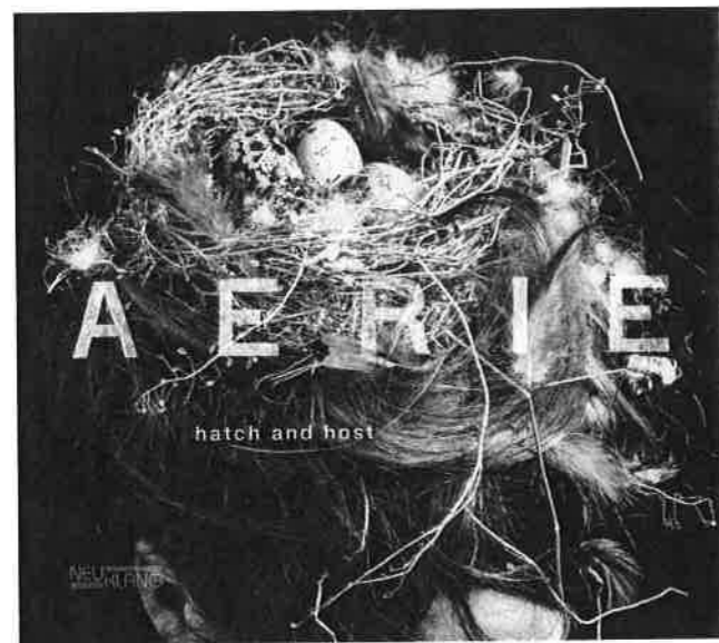
AERIE hatch and host NCD4123

自問對德國的音樂人並不太熟悉，不過鼎鼎大名的 Bauer Studio，我就熟到不得了：一家有數十年歷史的錄音公司，製作嚴謹認真，製版質素超群。Bauer公司的CD，不會刻意標榜錄音的方式，或使用甚麼昂貴的專業器材；但我用到過百萬元級的組合去試聽，每次我都找不到任何破綻。NEUKLANG是Bauer Studio旗下的Label之一，以爵士和現代音樂為主，論音效，每一張CD的臨場感都能達到罕逢對手的最高水平。今次三張NEUKLANG CD亦絕不例外。